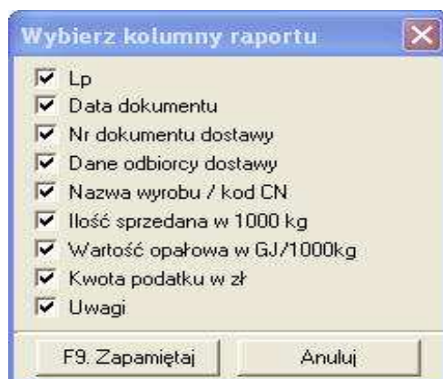
Rysunek 5: Wybór kolumn raportu

Poprzez użycie zakładki „Raport” w oknie „Dokumenty dostawy węgla” (patrz. Rys. 4) program umożliwia nam stworzenie zestawienia z wybranym przez użytkownika zakresem informacji (patrz. Rys. 5).